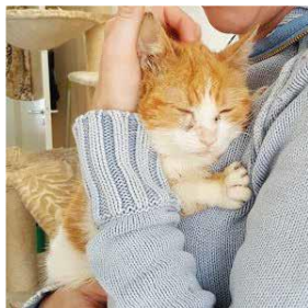
Afbeelding 3-20 mei Hij valt in slaap in de armen van mijn vriendin!

Nadat hij een goede maand thuis was en er een paar honderd gram bij was begint onze schattige katten sterker te worden. Tijdens een bezoek aan de dierenarts werd hij steeds "heftiger". Tijdens het onderzoeken vond hij het niet leuk meer om tegengehouden en geïmmobiliseerd te worden. Daardoor zei de dierenarts tegen hem: "maar je bent een echte kleine bandiet"... En zo kreeg dit kleine wondertje zijn naam.