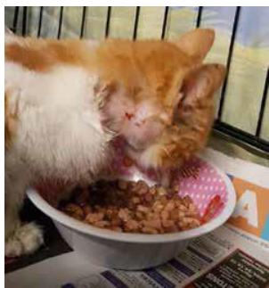
Afbeelding 2-18 april Op deze foto zien we de verwondingen ter hoogte van zijn nek. Een gelijkaardige verwonding bevond zich ook aan de andere kant.

Als we uiteindelijk thuis waren maakte ik voor hem een warm en gezellig nestje in een grote herstellingskooi. Ik gaf hem alles wat hij nodig had (nat- en droogvoer, kattenbak, speelgoed). Ondanks zijn ademhalingsproblemen had de kitten een goede eetlust (wat me erg blij maakte omdat een etend dier een goed teken is). Anderzijds keek hij niet eens naar het speelgoed, hij ging in zijn mandje liggen en viel in slaap.