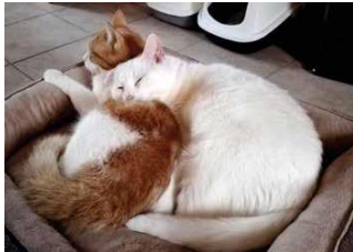
Afbeelding 5 HERMINE EN BANDIT, een gedeeld geluk!

Bandit rent als een gek overal rond en beschouwt het hele huis als een grote speeltuin met een Formule 1 circuit. Zelfs de trap vormt een enorme klimmuur waarvan hij kan genieten. Wat een vreugde om te weten dat dit schatje gered is en zo mooi wordt.