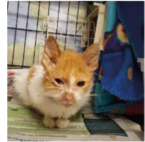
Afbeelding 1-18 april Foto genomen de dag na zijn aankomst thuis.

Op 17 april werd ik door een vriendin opgebeld om me de aanwezigheid van een kitten in slechte staat te melden. Het bevond zich in een tuin van oudere personen. Ik herinner me die ochtend goed, het was echt fris. Als die kleine schat de nacht buiten had doorgebracht moest hij zeker onderkoeld zijn... Onmiddellijk vroeg ik aan mijn vriendin om het dier zo snel mogelijk naar mijn dierenarts te brengen. Daar kreeg hij snel de eerste hulp. De kitten leed aan een ernstige coryza (luchtwegen en ogen vol met etter). Na een eerste schoonmaakbeurt belde de dierenarts me om me te laten weten dat de kitten meer ontspannen leek te zijn.