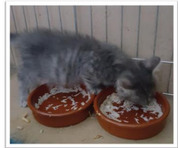
Afbeelding 2-30 augustus Chipie geniet van haar kippensoep en kan heel speels zijn.

De 5 kittens worden in een andere bench geplaatst met een verwarmingslamp en een kleine speeltuin aangepast aan hun energie... en toen kreeg ik plots een idee! Wat als deze kleine schat een soort "soep" van een bekend merk lekker zou vinden? De volgende dag ging ik deze beroemde "soep" kopen. Het zakje wordt geopend en miraculair, de jonge dame eet de hele portie met kippensmaak op. Uiteraard genieten ook haar broertjes en zusjes ervan. EINDELIJK heb ik haar zwakke punt gevonden. Ik ga terug naar de winkel om een enorme voorraad soep aan te leggen waarbij ik de twee beschikbare smaken (kip of vis) neem. Mejuffrouw heeft een voorkeur voor kip; mini Poesje weet heel goed wat ze wil. "Zeer goed Poesje, je eet alles op en ik ben trots op je maar wat doe ik met de vissoepjes die je niet lekker vindt?" "Je geeft ze aan mijn broers, ze eten alles op!" OK! Opgeloste zaak waarbij alle voorwaarden van Superpoes in hun geheel aanvaard worden. Pffft, als je met zo'n koppig beestje te maken hebt dan kan je het beter aanvaarden.