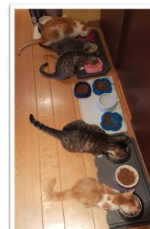
Afbeelding 4-28 september Chipie past in de vrolijke bende. Hoewel ze nog klein is, zoals op deze foto, heeft ze tussen de groten haar plaats gevonden.

Elke gift is waardevol, elke gift helpt om dieren in nood te redden. Dank u voor HEN.