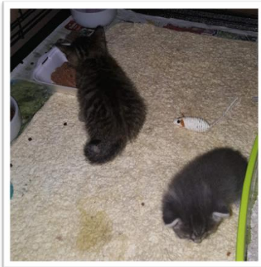
Afbeelding 1-22 juli

Een vriendin van mij die thuisverpleegster is, meldt meerdere kittens in de tuin van een oudere vrouw. Op 22 juli 2019 bezoek ik het huis van deze mevrouw en inderdaad, ik vind 5 zeer magere kittens die uit twee verschillende nesten lijken te komen. De kleinste is ongeveer 1,5 maand oud et de 4 oudere kittens zijn 2,5 maanden.