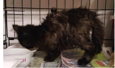
Afbeelding 2-26 maart 2019

Zijn gebroken bekken hinderde hem op 4 poten te staan en hij kroop om zich voort te bewegen. Ongeacht de inspanningen die hij moest leveren, ging Sherlock in zijn kattenbak zijn behoefte doen. Hij leert stilaan stappen en waardeert het speelgoed dat hij krijgt. Het was met grote vreugde dat ik hem van dag tot dag zag evolueren en ik genoot van zijn overwinning! Hij was gedoemd tot zo'n ellendig leven.