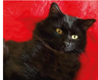
Afbeelding 5-19 januari 2020